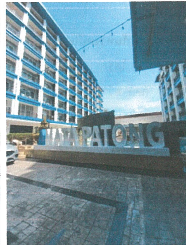
รูปภาพที่ 1.3 การใช้พื้นที่ของโครงการ